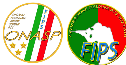
TABELLA SANZIONI ONASP 2018

(Disciplina sportiva del SOFT AIR - Specialità PATTUGLIE COMBAT a SCENARI - denominato PCS)